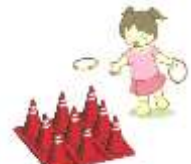
カラコーンむねげ

《お楽しみもいっぱい！》 コーヒー、みたらし団子をお得に販売！ 無料ゲームコーナーもあります。 じゃんけん大会を1日2回開催！