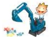
パワーショベルアメすくい

《港警察による【防犯講話】開催》 10月25日13:00~14:00 被害に遭わないためにぜひご参加ください 「コノハ警部も来館します!!」