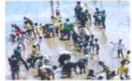
場所：港区西茶屋三丁目

今年は「三英傑」のデザインです。 5月17日に田植えを行いました。 見ごろは6月下旬～7月上旬です。 7月5日(日)に観察会も予定されています。 ぜひご家族でお出かけください!