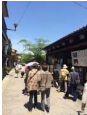
楽しい散策中(左)と京弁当(下)